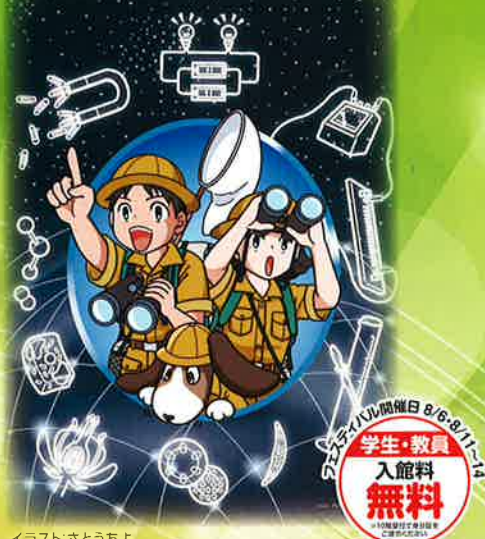
イラスト:さとうちよ